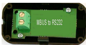
RS 232 > MBUS Adapter für das Modul F1o

Die Anzeigen sind kundenspezifisch konfigurierbar.