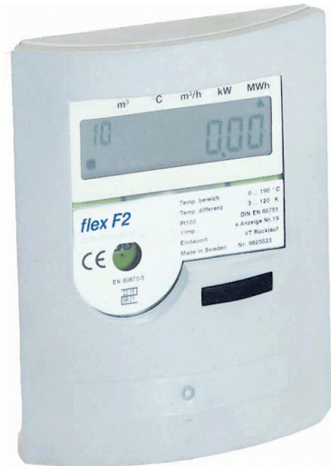
Wärmezähler - Wasserzähler - Grundgerät F2