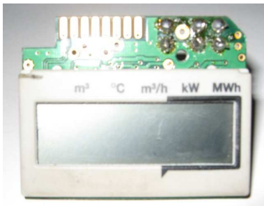
Wärmezähler - Wasserzähler - Modul F1o

Die Anzeigen sind kundenspezifisch konfigurierbar.